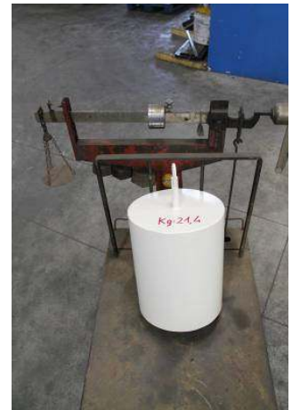
Dopo il CRASH